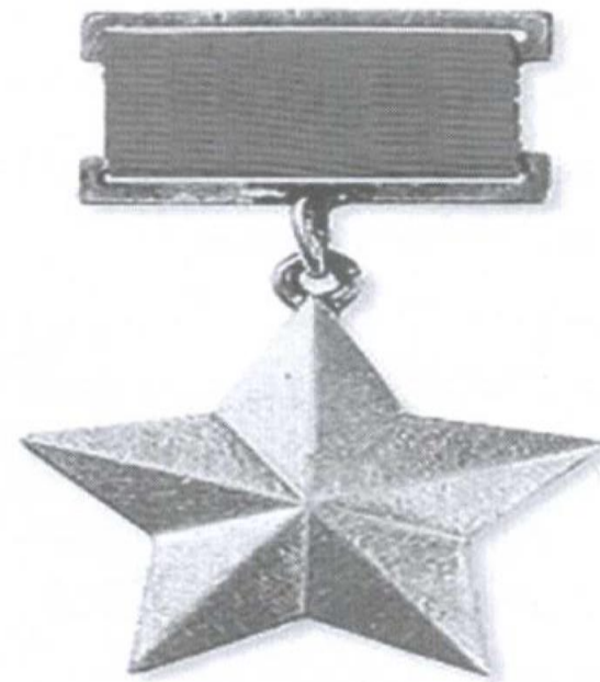
Звезда Героя Советского Союза